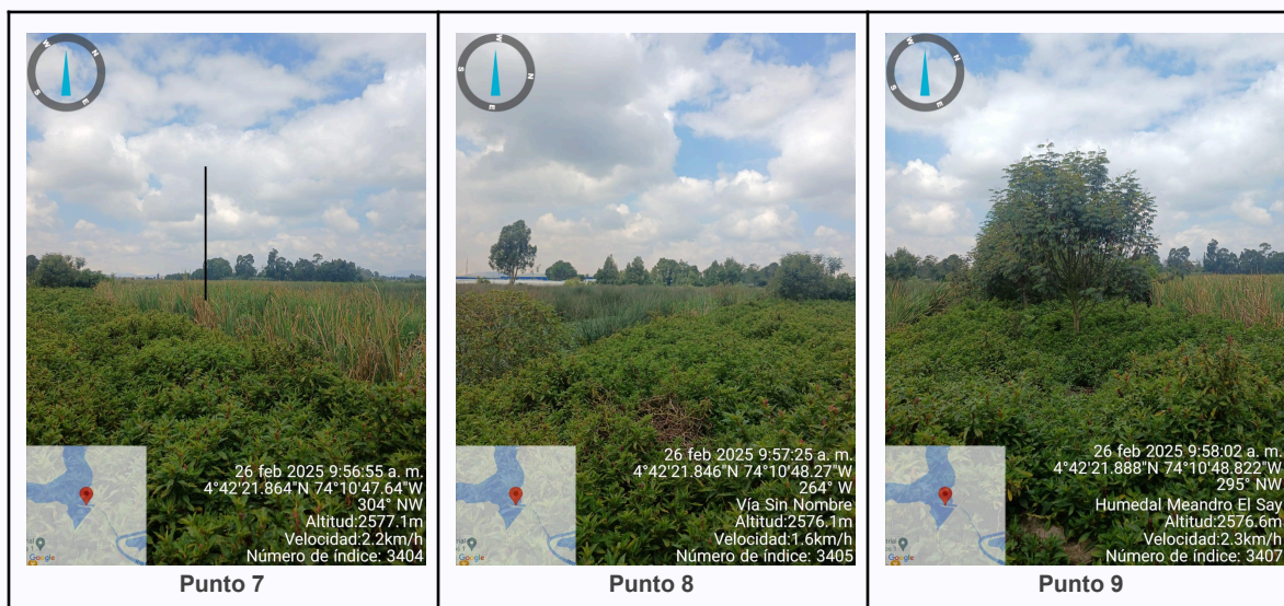
Ilustración 2. Fotos de los puntos del Recorrido de Control Y Vigilancia Ronda Del Humedal Gualí..

C.P 250020 Tel. (601) 8234070 823 40 71 / 823 40 73 Fax. (601) 8257620 Dir. Cra. 14 No. 13-05 03-FR-17 VER.10.2024